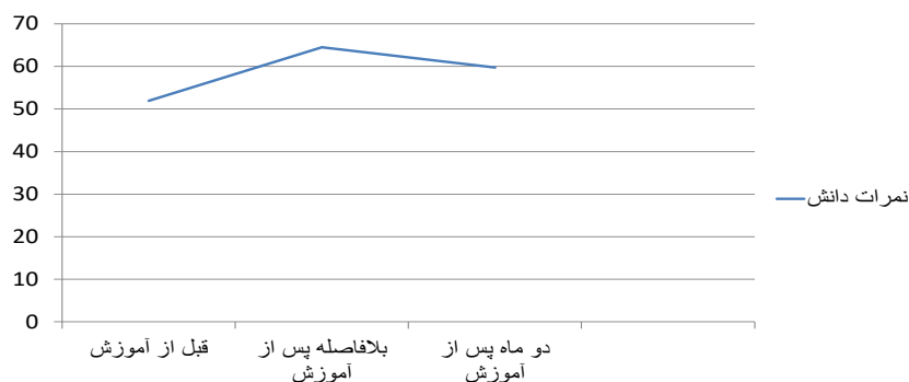
نمودار ۱. مقایسه نمرات دانش بین سه مرحله